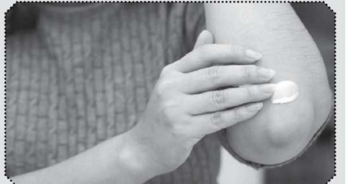
தொகுப்பு :- சப்தலி

ஆலிவ் எண்ணெயுடன் சர்க்கரை சேர்த்து குழைத்து உடனடியாக முட்டியில் தேய்க்கவும். தினமும் இதை செய்யலாம். குளியலுக்கு முன்பு இதை செய்து வரலாம். தொடர்ந்து செய்து வந்தால் கருமை மறைவதை பார்க்கலாம்.