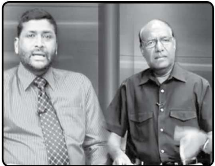
இதை நினைவு கூற வேண்டும்?