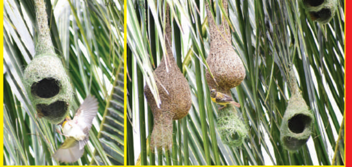
தூக்கணாங்குருவிகளின் கூடு கட்டும் அழகே தனித்துவம். மேசன்மார் ஒரு விட்டை கட்டுவதைப்போல அழகாக இருக்கும். இவை சத்தமற்ற, ஆரவாரமில்லாத இடங்களிலேயே கூடுகள் அமைக்கும்.

தீப ஒளி திருநாள் என்பது கொண்பட்டத்தின் உச்சம் தான் என்ற யோத்தனும் அந்த உலகம் மனிதனுக்கு மட்டுமாவது அல்ல என்பதையம் சற்றே உணர்ந்து செயல்படுவோம், ஆரியனை காட்டினும் உச்ச யட்ச ஒளி உலகில் அல்லை, சின்னஞ்சிறு புறவைகளின் ஒளியை கேறடி யட்டாககள் அனைந்தானும் கொடுக்காது என்ற புத்தலோடு தீப ஒளி திருநாளை கொண்படுவோம்.