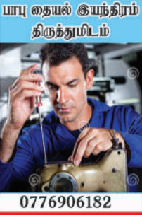
யாபு தையல் இயந்திரம் திருத்துமிடம்