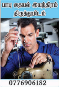
யாழ் தையல் இயந்திரம் திருத்தும்படம்