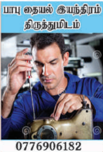
யாபு தையல் இயந்திரம் திருத்துமிடம்