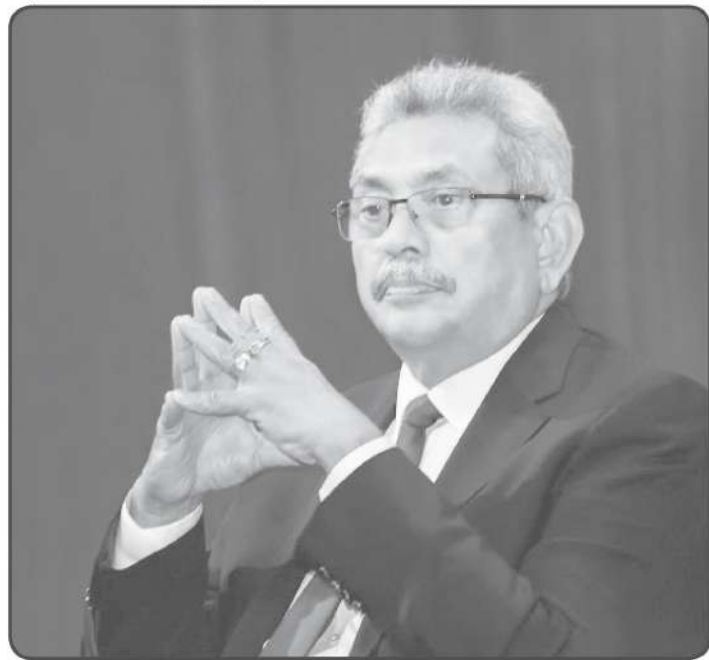
ஒப்படைக்கப்பட்டதாக ஒரு தோற்றம் நிலவியது. குறிப்பாக ஜெனிவா மைய அரசியலில் மிகவும் விசைத்திறனோடு செயற்படுவது டயஸ்போறா தான்.

குறிப்பாக 2009க்குப்பின் தோல்வியை ஒழிக்கொள்ள முற்றுத் தீர்க்கான போராட்டத்தைத் தொடர்ச்சியாக முன்னெடுத்து வருவது தமிழ் டயஸ்போறா தான். 2009க்கு பின் தாயகத்தில் காணப்பட்ட அச்சச்சூழல் காரணமாக தமிழ் டயஸ்போறாவிடமே போராட்டத்தின் அஞ்சலோட்டக் கோல்