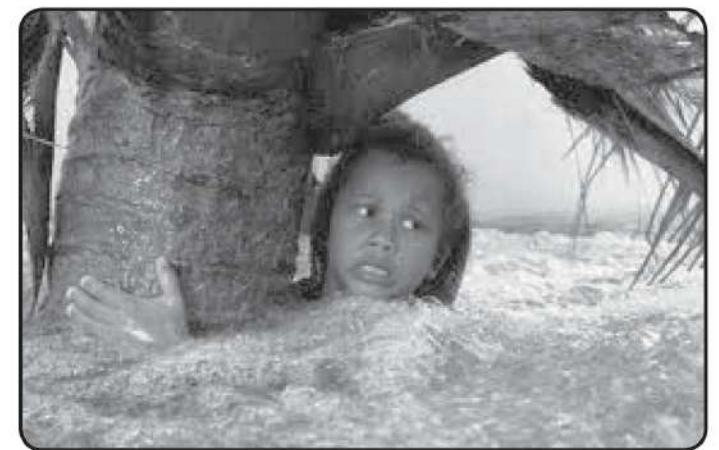
அகதி வாழ்க்கை, நிவாரண தொடர்கள்.