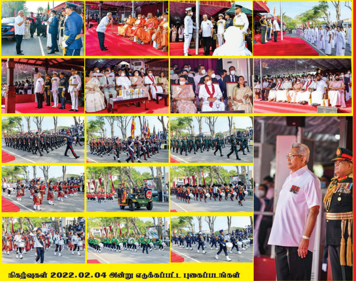
நிகழ்வுகள் 2022.02.04 அன்று எடுக்கப்பட்ட புகைப்படங்கள்

நாட்டிற்கான வளமுள்ளவர்களை நிறைவேற்றுவதன் மூலம் தமக்கு கிடைத்த சுதந்திரத்தை அனைவரும் பயன்படும் செயல் முறையும் என கனாதிபதி கோட்டாபய ராசபக்ஷ தெரிவித்துள்ளார். சுதந்திரமான, சனநாயக நாடு என்ற வகையில் அனைவருக்கும் உரிமைகள் மற்றும் வளமுள்ளவர்களை உள்பட கனாதிபதி, வளமுள்ளவர்களை மறந்துவிட்டு உரிமைகள் பற்றி மாத்திரம் பேசுவது ஒத்தபடிதான் எனவும் தெரிவித்துள்ளார். கொழும்பு சுதந்திர சூழலில் அன்று (04) முற்பகல் 10.00 மணிக்கு 74 ஆவது தேசிய சுதந்திர தின நிகழ்வில் நாட்டு மக்களுக்கு உரையாற்றும் போதே கனாதிபதி இதனைக் குறிப்பிட்டுள்ளார்.