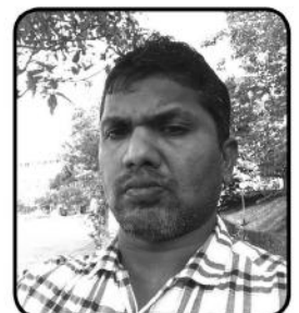
புயல்நெலும், தலைவர், புதுமை எழுத்தாளர் ஒன்றியம், இலங்கை.