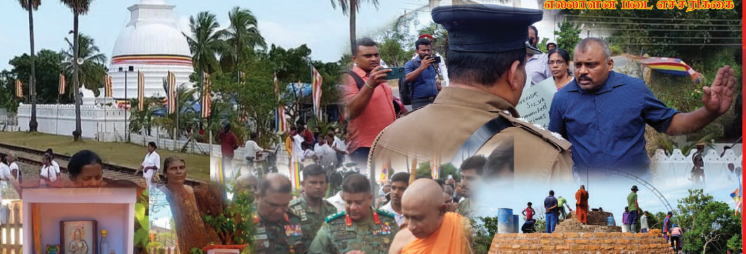
எல்லாளன் படை, எச்சரிக்கை