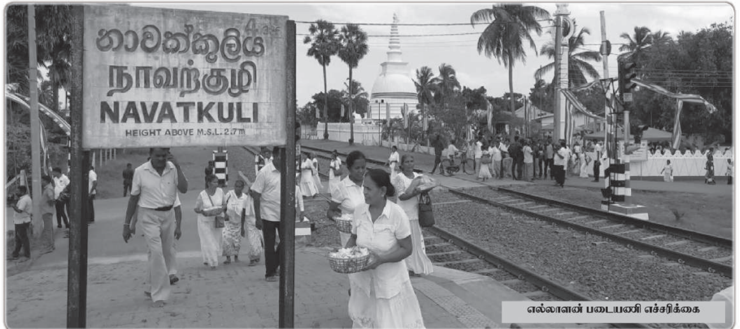
எல்லாள் படையணி எச்சரிக்கை

இன்றைய சமகால அரசியல் பார்வையிலே புதிய பௌத்த கோவில்கள் பல நிறுவப்பட்டுள்ளது தமிழர் தாயக பிரதேசத்திலே. கிளிநொச்சியிலும் யாழ்ப்பாணத்திலுமாக வடகிழக்கில் மூன்று இடங்களிலே பௌத்த விகாரைகள் தாழ்ப்புழி வீடுதலைப்புலிகளின் கட்டுப்பாட்டின் கீழ் இருந்திருக்கின்றது. அதை அவர்கள் ஒரு இனவாதமாக பார்க்கவில்லை அல்லது மதவாதமாக பார்க்கவில்லை பௌத்தர்கள் புத்தரை பாதுகாப்பாக பேணி அந்த இடங்களிலே விகாரைகள் அவ்வாறே இருந்தது அனைவரும் அறிந்த விடயமே. ஆனால் யுத்தத்தின் பின்னர் ஆயிரம் புத்தர் சிலைகளை வடகிழக்கில் அமைக்க வேண்டும் அல்லது தொல்பொருள் ஆராய்ச்சி என்ற வயறிலே தமிழர் பிரதேசங்களை சுரண்ட வேண்டும் அங்கு பௌத்த எச்சங்களை போட்டு இது புராண காலத்திலே யாழ்ப்பாணப் பௌத்தர்கள் வாழ்ந்தார்கள் என்ற அடிப்படையிலே கொடுக்கின்ற நோக்கிலே அவர்கள் இவ்வாறு செயற்பட்டுக் கொண்டிருக்கின்றார்கள்.