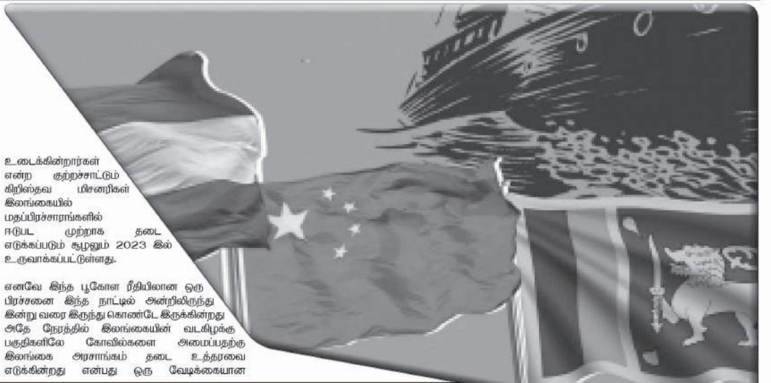
உடைக்கின்றார்கள் என்ற குற்றச்சாட்டுமீறிய மிசனரிகள் இலங்கையில் மதப்பிரச்சாரங்களில் ஈடுபட முற்றாக தடை எடுக்கப்படும் சூழலும் 2023 இல் உருவாக்கப்பட்டுள்ளது.

இன்றைய சமகால அரசியல் பார்வையில் இலங்கை தீவு என்ற அடிப்படையில் பல்வேறுதரப்பட்டவர்கள் இன்று தமது காலணித்துவத்தை கொண்டு வர வேண்டும் என்ற அடிப்படையில் செயற்படுகின்றார்கள். குறிப்பாக சீனாவின் ஆதிக்கம் இந்தியாவை விட மேலோங்கி நிற்கின்றது என்று கூறலாம். அதற்கு அடுத்தபடியாக அமெரிக்காவின் தலையீடு இங்கு காணப்படுகின்றமையும் ஒரு விசேட அம்சமாக பார்க்கப்படுகின்ற காரணம் என்னவென்றால் இன்று போர்ட்ஸிற்ரியாக இருக்கலாம் அல்லது அப்பாந்தோடே துறைமுகமாக இருக்கலாம் அல்லது தாமரை தாசுமாக இருக்கலாம் இவ்வாறு எல்லாம் இலங்கையிலே அதனை வைத்து காணான்றிய சீனா இன்று அவர்களது மொழிவாதியான நடவடிக்கைகளையும் இலங்கையில் மேற்கொண்டு வருகின்றது. ஒரு மொழியை ஒரு நாட்டில் காணான்ற வைத்தால் உண்மையிலே அந்த இனம் காக்கப்படும் என்பது தான் அதன் மற்றுமொரு பொருளாக இருக்கின்றது. எனவே மொழியை அடிப்படையாக கொண்டு சீன கல்லூரிகளை ஆரம்பிப்பதற்கும் சீனாவின் நடவடிக்கைகள் இங்கிருந்து செயற்படுத்துவதற்கான நடவடிக்கைகளை அவர்கள் செய்து வருகின்றார்கள். போர்ட்ஸிற்ரிய என்ற ஒரு விடயம் என்பது அதில் சகல கலையாட்டி விடயங்களும் உள்ளடக்கப்பட்ட ஒன்றாகவே