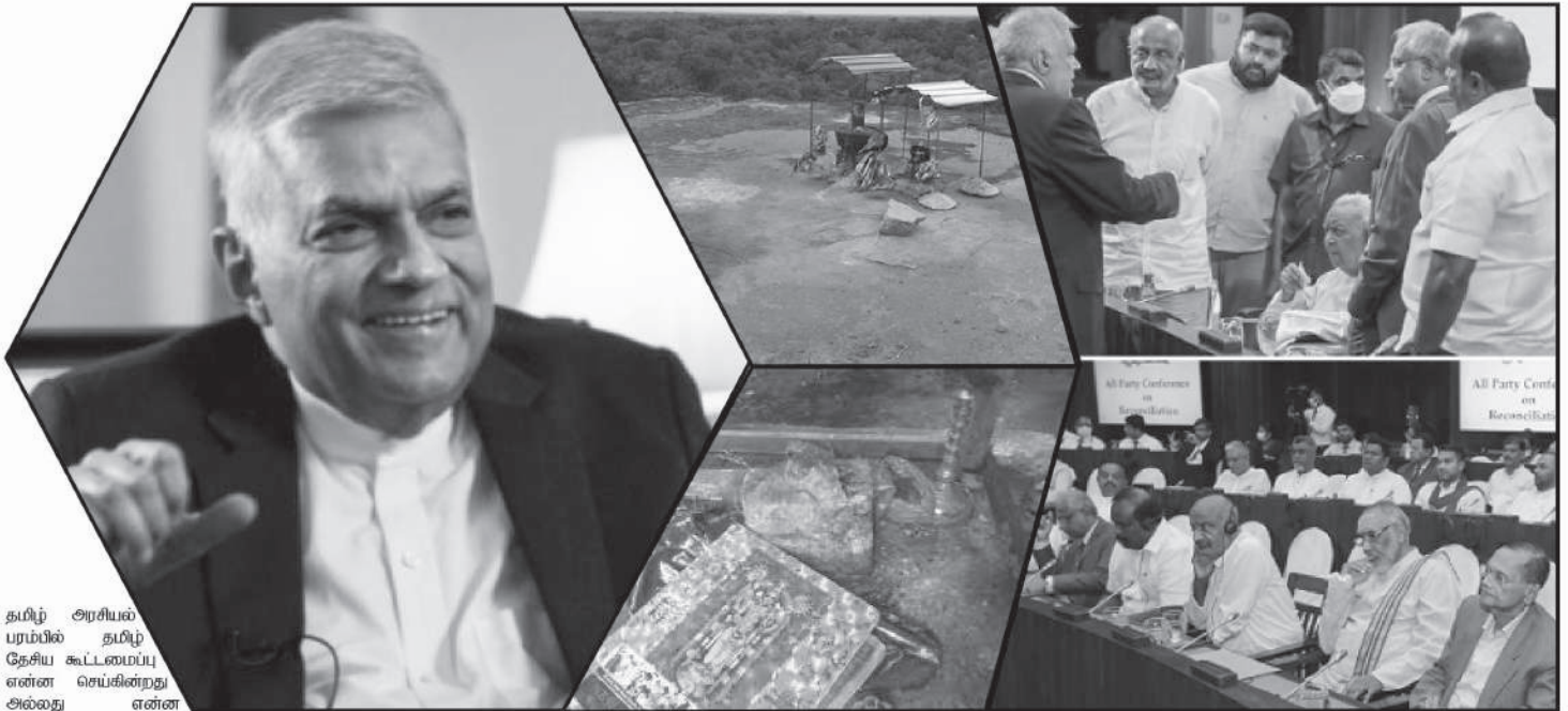
தமிழ் அரசியல் பரம்பில் தமிழ் தேசிய கூட்டமைப்பு என்ன செய்கின்றது அல்லது என்ன