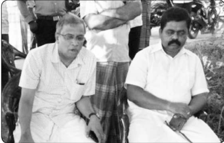
சாணக்கியர் கூறுவார். மொத்தத்தில் சம்பந்தர் ஒரு தோல்வியுற்ற தலைவராக ஓய்வு பெறப் போகின்றாரா?