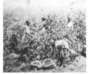
விவசாயத்திற்கான நீர்ப்பாசன முறைகளை பெரிதும் சார்ந்திருந்தது.

காலநிலை மாற்றத்தின் விளைவுகளை சீர்திரு அனைவரும் அனுபவிக்கின்ற நிலையில் பசுமை நோக்கிய நகர்வு குறித்த விழிப்புணர்வும் அக்கறையும் பரந்துபட்டளவில் மக்களைச் சென்றடைந்துள்ளது. பசுமையில் பெயரால் வளர்ச்சியடைந்தால், உரிமை மறுப்புகள், மோசடியான வர்த்தகம், யோலியான திட்டங்கள் என அனைத்தும் அரங்கேறுகின்றன. குறிப்பாக ழுன்றாமுலை காடுகள் இதற்குப் பலியாகின்றன. இலங்கையும் இதற்கு விலக்கல்ல. இலங்கை உயிரினங்களின் செறிவு அடிப்படையில் ஆசியப் பிராந்தியத்தில் முக்கியமான நாடாக கருதப்படுகிறது. ஆனால் இலங்கையின் உயிர்ப்பல்வகைமை மிகப்பாரிய சவாலான எதிர்கொண்டுள்ளது. கடந்த இரண்டு தசாப்த காலத்தில் காலநிலை மாற்றத்தின் கொடும் விளைவுகளையும் இலங்கை சந்தித்துள்ளது. இவை குறிப்பாக விவசாயத் துறையை சீரழித்துள்ளது. உயரும் கடல்மட்டம் இலங்கைக்கு ஒரு மிகப்பெரிய சவாலாக உருவெடுக்கும் வாய்ப்புகளும் உண்டு. இத்தகைய பின்புலத்தில் இலங்கைக் கழலில் பசுமை எனும் பெயரால் நடைபெறுகின்ற விடயங்களைத் தத்துவார்த்த ரீதியிலும் வரலாற்று நோக்கிலும் சமகால நிகழ்வுகளுடனும் நோக்கி இத்தொடர் விழைகிறது. பசுமையின் பெயரால் நடந்தேறப்பவை ஏற்படுத்தும் சமூகப் பொருளாதார மாற்றங்களையும் அதன் அரபியல் சிக்கல்களையும் சேர்த்தே 'பசுமை எனும் பேரபாயம்' எனும் இத்தொடர் கவனம் செலுத்துகிறது.